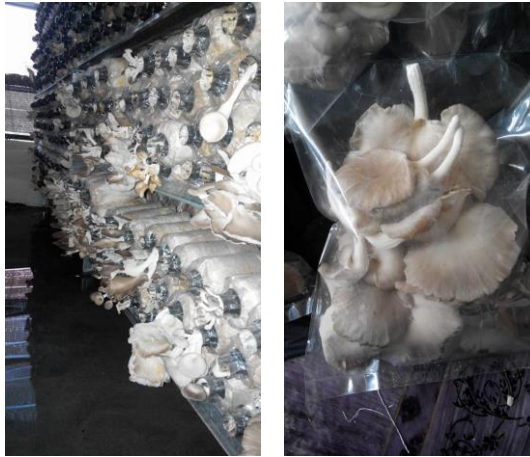
Caption : Penanaman cendawan tiram kelabu serta hasilnya